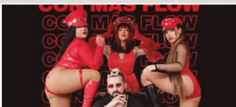
FIESTA "CON MÁS FLOW" - 23-30 H - ESCENARIO DE LA REINA