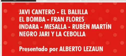
FESTIVAL RADIOLÉ - 22-00 H - ESCENARIO LA COMARCA