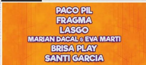
MOLAN LOS 90's - 22-00 H - ESCENARIO LA COMARCA