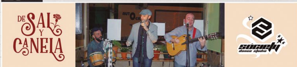
III TALAVERA FEST - 19-00 H - ESCENARIO LA COMARCA